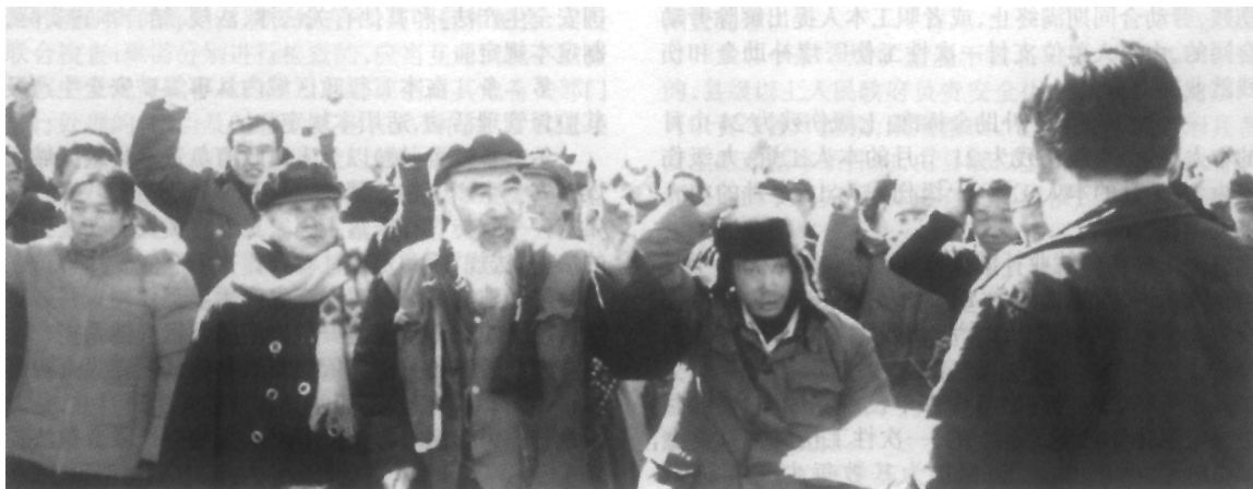
太原市社交曲镇小河沟整村推进项目规划进行举手投票公选