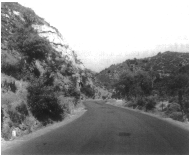
忻州市农村水泥(油)路建设

房地产建设规模和当年完成投资。2004 年,房地产业成为全国宏观调控的“热点”之一,土地和贷款两个“闸门”的收紧直接影响房地产开发力度和商品房工程建设的投资力度,使房地产业呈现出平稳增长的态势。当年房地产开发投资(不含基建、更改投资中的住宅投资)完成 125.8 亿元,比 2003 年增长 32.3%。其中,商品房建设投资 91.2 亿元,增长 38.2%;土地开发