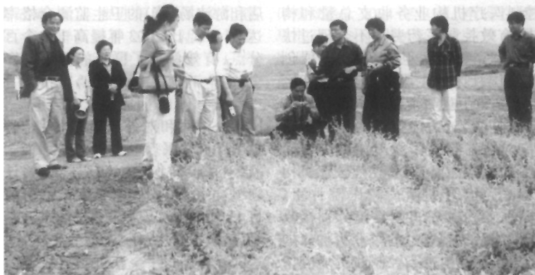
国家科技部专家在陵川县党参、柴胡中药材规范化种植基地考察

【农村卫生工作】 认真学习宣传和贯彻《山西省农村初级卫生保健条例》和省委、省政府《贯彻〈中共中央国务院关于进一步加强农村卫生工作的决定〉的实施意见》,出台了9个政策性配套文件。给35个国定贫困县配发了巡回医疗车。首次实行乡村医生资格考试制度,1.9万人参加了考试。完成了110个县(市、